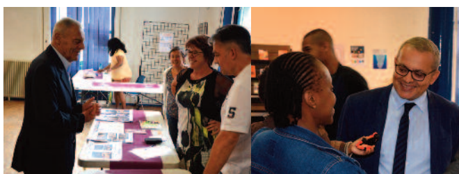
Moment de convivialité où les habitants ont pu échanger avec les services avant la nouvelle rentrée scolaire sur les différentes activités proposées par la Ville.