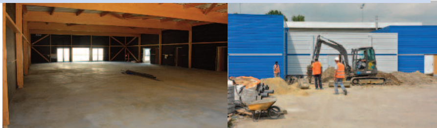
Travaux du Dojo : l'avancement des aménagements intérieurs.