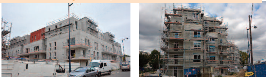
De gauche à droite : L'Orée du Bois et les terrasses d'Hélis, deux chantiers concernant la construction de résidences, vont bientôt voir le jour à Dugny. Ces deux résidences pourront accueillir plus de 110 logements.