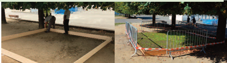
Tests de ré-engazonnement permettant de reverdir les cours d'école. Résultats concluants.