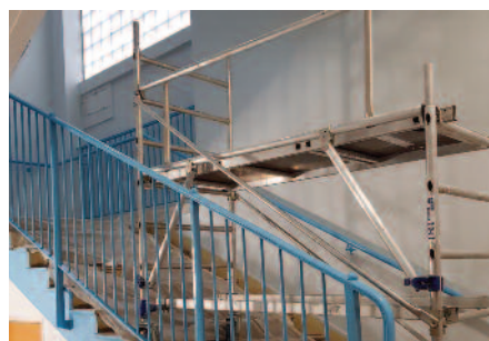
Mise en peinture des 2 cages d'escaliers des extrémités.

Je souhaite par ces quelques mots vous souhaiter une excellente année 2018. Que celle-ci puisse vous être bénéfique tant professionnellement que personnellement. Avec mon équipe, nous ferons tout notre possible pour faire en sorte que Dugny puisse représenter au mieux le cadre de vie dans lequel vous souhaitez vivre.