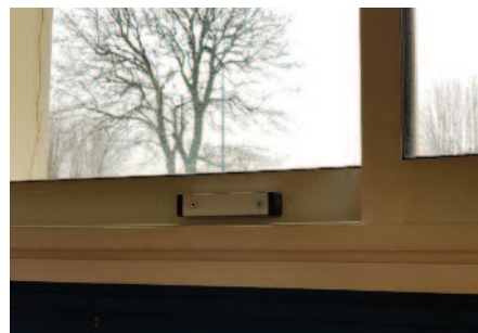
Mise en sécurité des fenêtres coulissantes par la mise en place de butées.