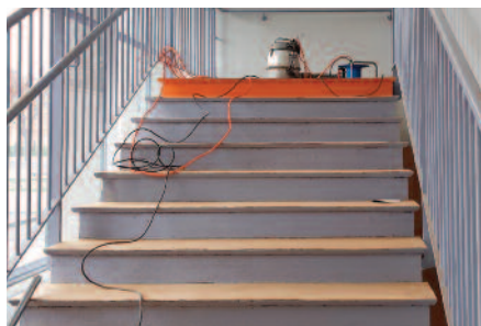
Vernissage des marches escaliers du milieu.

Pendant les vacances de décembre, la ville a réalisé des travaux de peinture, vernissage ou encore de mise en sécurité sur les écoles Langevin et Wallon.